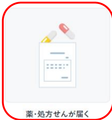
薬・処方せんが届く