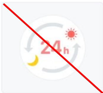
24時間いつでも予約可能