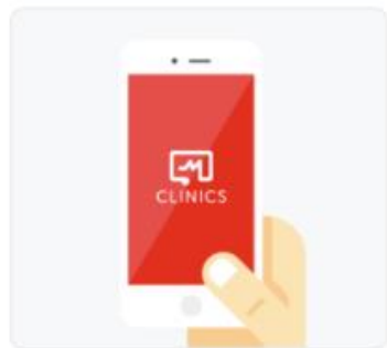
スマホで受診できる